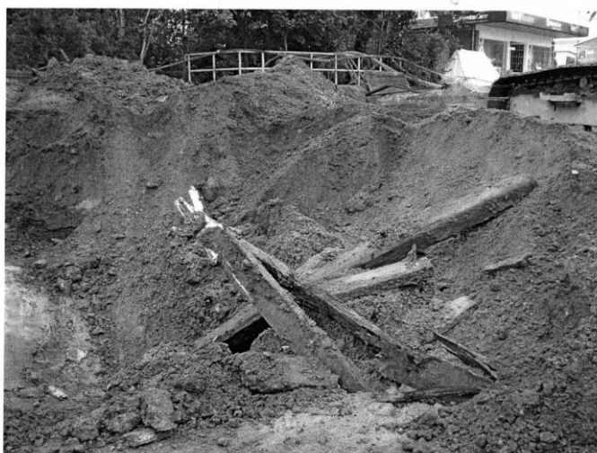
Fundet, i baggrunden ses resterne af den nye bro til Hovedgaden. 4

Ved påbegyndelsen af gravearbejdet stødte gravemaskinen pludselig på gammelt træ, og arbejderne stoppede med det samme og tog kontakt til Lokalhistorisk Forening i Billund, desuden tog føreren af gravemaskinen sit kamera og forevige fundene i udgravningen.