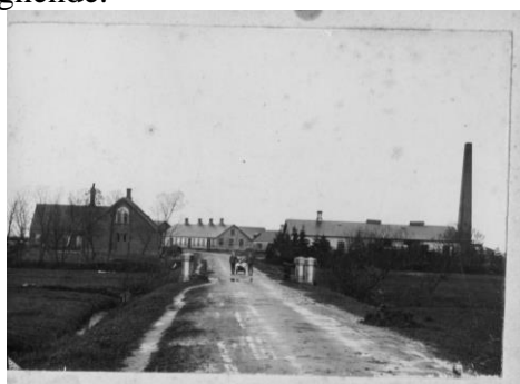
Hovedgaden set fra syd med den nye bro ca. 1910

Hvorfor kom den til at hedde Gammelbro, det var selvfølgelig fordi der i 1862-63 blev lavet en ny bro over bækken lige vestligere. Det skete i forbindelse med anlæggelsen af en vej gennem Billund fra Vejle til Grindsted. Vejen skulle selvfølgelig gå forbi kroen og måtte derfor anlægges lidt længere mod vest, derefter drejede den mod nord mod bækken, hvor der blev bygget den overgang over bækken, som vi der har boet i Billund en del år kan huske, da den udgjorde indkørslen til Hovedgaden. Den bro er nu også fortid, men den har vi billeder af. Den var fra starten selvfølgelig ikke asfalteret, men den var så bred, at to vogne kunne passere hinanden, desuden blev den markeret af 4 hvide cementstolper. Da den blev anlagt fik den første bro sit navn "Gammelbro". Nu begyndte Billund også at udvikle sig. I løbet af de næste 20 år byggede man det første mejeri, der ses til højre på billedet nedenfor. Det lå, hvor nordfløjen af Rådhuset ligger i dag, og senere kom der flere til - håndværkere og lignende.